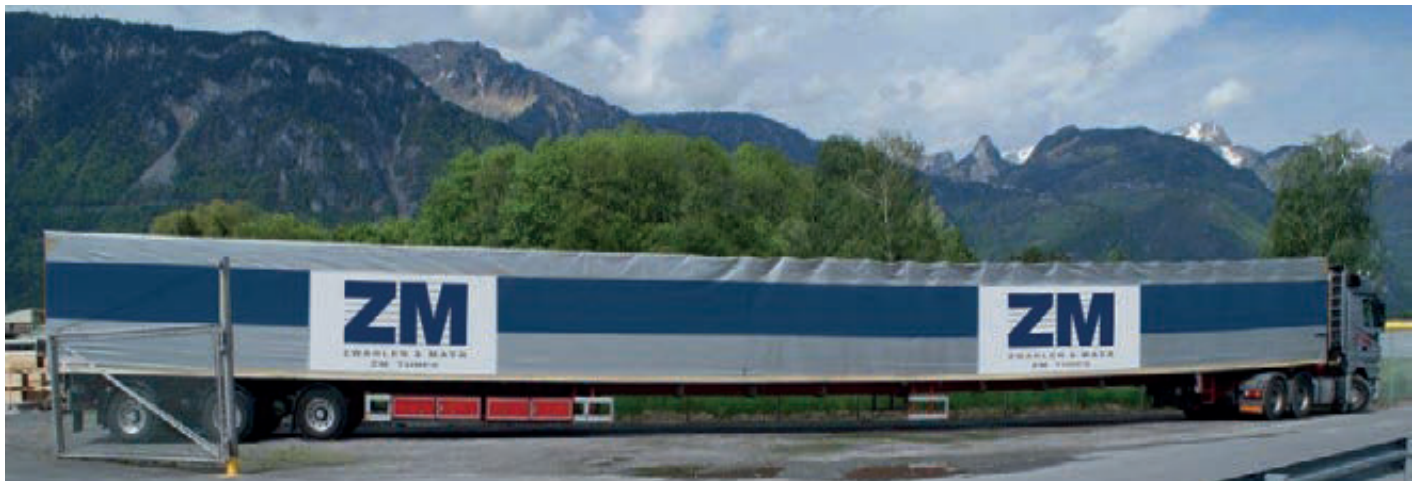
LKW 30 METER LANG